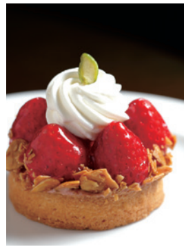
impression 神戸市東灘區御影 2-2-5 [營]10:00-20:00(L.O.19:30) [休]1月1日 [交]從阪急御影站徒步 3 分鐘 ☎ +81-78-856-4600