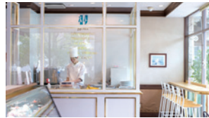
讓人感動 酥脆口感的千層糕