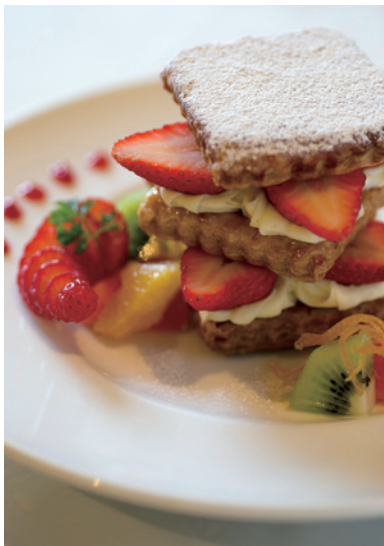
御影高杉 神戸市東灘區御影 2-4-10-101 [營]10:00-20:00 [休]不定期休息 [交]從阪急御影站徒步 3 分鐘 ☎ +81-78-811-1234 http://mikage-takasugi.com/